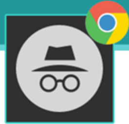
Incognito Window di Chrome