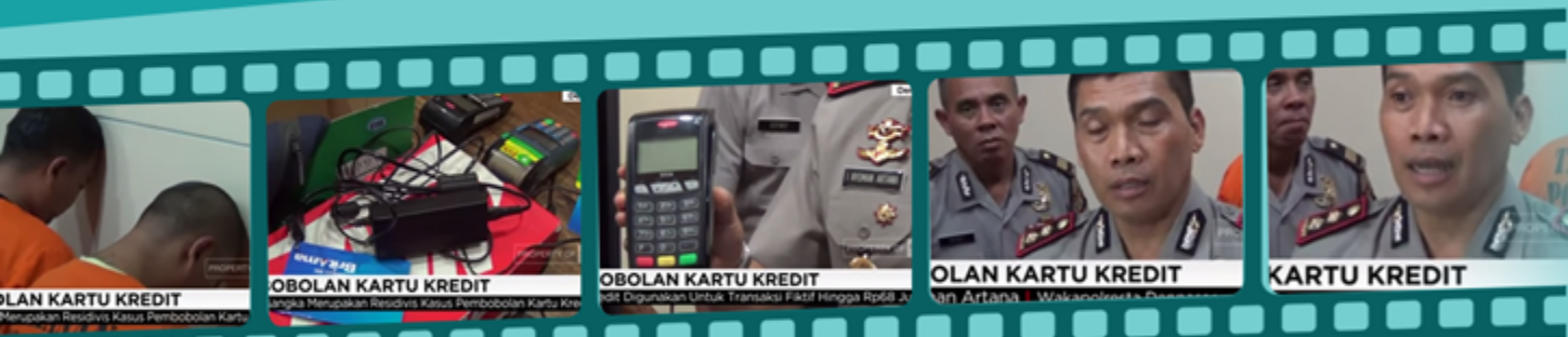
Pembobolan Kartu Kredit Diunggah oleh CNNIndonesia s.id/videoproteksi